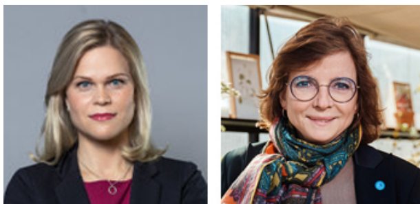
Paulina Brandberg, Jämställdhets- och arbetslivsminister, Sverige och Karen Ellemann, Generalsekreterare för Nordiska Ministerrådet

I över 50 år har de nordiska regeringarna samarbetat för att främja jämställdhet mellan könen.