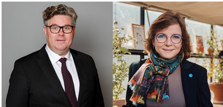
Gunnar Strømmer dómsmálaráðherra Svíþjóðar og Karen Ellemann framkvæmdastjóri Norrænu ráðherranefndarinnar

Norrænt samstarf á sviði dómsmála styður við framtíðarsýn norrænu forsætisráðherranna um að Norðurlönd verði sjálfbærasta og samþættasta svæði heims árið 2030.