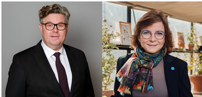
Ruotsin oikeusministeri Gunnar Strömmer ja Pohjoismaiden ministerineuvoston pääsihteeri Karen Ellemann

Oikeusalan pohjoismaisen yhteistyön tavoitteena on osaltaan edistää Pohjoismaiden pääministerien visiota, jonka mukaan Pohjolasta tulee maailman kestävin ja integroitunein alue vuoteen 2030 mennessä.