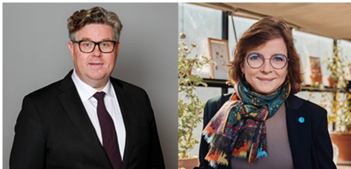
Sveriges justitsminister Gunnar Strömmer og Nordisk Ministerråds generalsekretær Karen Ellemann.

Det nordiske justitssamarbejde bidrager til at realisere de nordiske statsministres vision om, at Norden skal blive verdens mest bæredygtige og integrerede region mod år 2030.