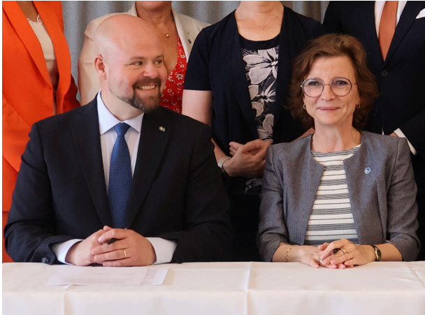
Peter Kullgren, landsbyggðarráðherra Svíþjóðar og Karen Ellemann, framkvæmdastjóri Norrænu ráðherranefndarinnar.

Það á að vera spennandi að búa, starfa, stunda nám og reka fyrirtæki hvar sem er á Norðurlöndum. Þeirri nýju stöðu sem upp er komin í heimsmálunum fylgja jafnframt auknar kröfur í tengslum við öryggismál, afkomu og viðbúnaðarmál. Það er lykilatriði að norrænu löndin sinni þessu í sameiningu og vinni þvert á landamæri svo að hægt sé að byggja græn, samkeppnishæf og félagslega sjálfbær Norðurlönd sem búa við öflugan viðnámsþrótt og aðlögunarfærni þannig að við getum gert að veruleika sameiginlega framtíðarsýn okkar um að Norðurlönd verði sjálfbærasta og mest samþætta svæði heims árið 2030.