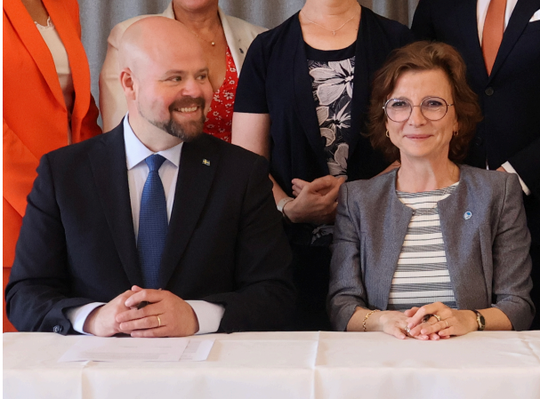
Ruotsin maaseutuministeri Peter Kullgren ja Pohjoismaiden ministerineuvoston pääsihteeri Karen Ellemann.

Pohjolan tulee olla houkutteleva paikka asua, elää, opiskella, työskennellä ja toimia yrittäjänä. Samaan aikaan uusi geopoliittinen tilanne asettaa entistä suurempia vaatimuksia turvallisuudelle, huoltovarmuudelle ja varautumiselle. Pohjoismaiden on käsiteltävä tilannetta yhdessä, ja tästä syystä tarvitaan yhteistyötä yli Pohjoismaiden rajojen vihreän, kilpailukykyisen ja sosiaalisesti kestävä Pohjolan puolesta, jolla on vahva häiriönsieto- ja sopeutumiskyky, jotta saavutamme yhteisen visiomme Pohjolasta maailman kestävimpanä ja integroituneimpana alueena vuoteen 2030 mennessä.