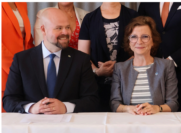
Landsbygdminister Peter Kullgren och Nordiska ministerrådets generalsekreterare Karen Ellemann.

Det ska vara attraktivt att bo, leva, studera, arbeta och driva företag i hela Norden. Samtidigt ställer den nya geopolitiska situationen ökade krav på säkerhet, försörjning och beredskap. Att de nordiska länderna hanterar detta tillsammans och samarbetar över gränserna är en avgörande förutsättning för ett grönt, konkurrenskraftigt och socialt hållbart Norden med en stärkt motståndskraft och anpassningsförmåga så att vi kan uppnå vår gemensamma vision om att Norden ska vara världens mest hållbara och integrerade region 2030.