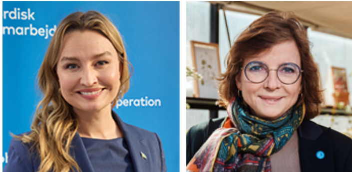
Ebba Busch, orku- og viðskiptaráðherra Svíþjóðar og Karen Ellemann framkvæmdastjóri Norrænu ráðherranefndarinnar

Öll starfsemi Norrænu ráðherranefndarinnar miðast við Framtíðarsýnina 2030 um að Norðurlönd skuli verða sjálfbærasta og samþættasta svæði heims fyrir árið 2030. Löndin halda fast í markmið framtíðarsýnarinnar á tímum þar sem breytt landfræðipólítísk staða skapar nýjar áskoranir. Hröð tækniþróun felur í sér auknar kröfur til atvinnulífsins en felur jafnframt í sér tækifæri fyrir nýsköpun og grænan hagvöxt.