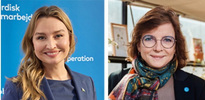
Ruotsin energia ja elinkeinoministeri Ebba Busch ja Pohjoismaiden ministerineuvoston pääsihteeri Karen Ellemann.

Pohjoismaiden ministerineuvoston kaikki toiminta pohjautuu visioon, jonka mukaan Pohjolasta on määrä tulla maailman kestävin ja integroitunein alue vuoteen 2030 mennessä. Maat pitävät kiinni vision tavoitteista samaan aikaan, kun muuttunut geopolitiittinen tilanne tuo mukanaan uusia haasteita. Teknologian nopea kehitys asettaa uusia vaatimuksia elinkeinoelämälle ja tarjoaa samalla tärkeitä mahdollisuuksia innovaatioille ja vihreälle kasvulle.