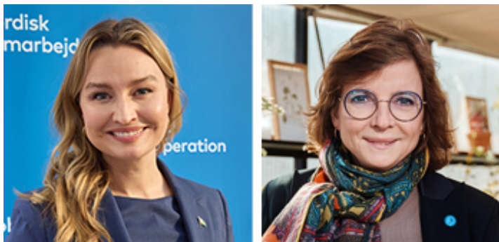
Sveriges Energi- och näringsminister Ebba Busch och Nordiska minsisterrådets generalsekreterare Karen Ellemann.

Alt arbeid i Nordisk ministerråd er rettet mot Vision 2030 om at Norden skal bli verdens mest bærekraftige og integrerte region innen 2030. Landene holder fast i visjonens ambisjoner på samme tid som en endret geopolitisk situasjon skaper nye utfordringer. Den hurtige teknologiske utvikling stiller nye krav til næringslivet og skaper samtidig viktige muligheter for innovasjon og grønn vekst.