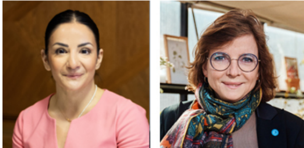
Parisa Liljestrand, menningarmálaráðherra Svíþjóðar og Karen Ellemann, framkvæmdastjóri Norrænu ráðherranefndarinnar

Samstarf norrænna ráðherra um listir, menningarmál og fjölmiðla er kjarnasvið innan Norrænu ráðherranefndarinnar. Á Norðurlöndum stöndum við sterkar saman ef við störfum saman að menningarmálum þvert á landamæri. Á tímum mikilla innri og ytri breytinga á samfélögum og umheiminum kemur í ljós að frjálst og lifandi menningarlíf og frjálsir fjölmiðlar skipta höfuðmáli til að viðhalda samtakamætti, von og lífsgæðum.