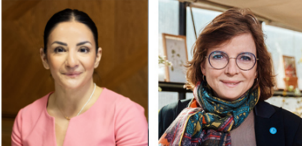
Ruotsin kulttuuriministeri Parisa Liljestrand ja Pohjoismaiden ministerineuvoston pääsihteeri Karen Ellemann

Pohjoismaiden kulttuuriministerien taiteen, kulttuurin ja median alalla tekemä yhteistyö on yksi Pohjoismaiden ministerineuvoston ydinalueista. Pohjoismaat ovat yhdessä vahvempia rajojen yli kehitettävän kulttuuriyhteistyön ansiosta. Yhteiskunnassa ja ympäristössä tapahtuvien isojen sisäisten ja ulkoisten muutosten myötä käy yhä selvemmäksi, että vapaalla ja elävällä kulttuurielämällä ja vapaalla medialla on ratkaiseva merkitys yhteenkuuluvuuden, toivon ja elämänlaadun kannalta.