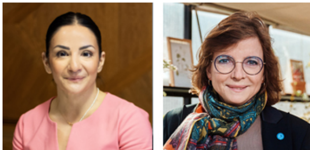
Parisa Liljestrand, kulturminister, Sverige og Karen Ellemann, Nordisk minisisterråds generalsekretær

De nordiske kulturministrenes samarbeid om kunst, kultur og medier er et kjerneområde i Nordisk ministerråd. I de nordiske landene står vi sterkere sammen gjennom et utviklet kultursamarbeid over grensene. I møte med store indre og ytre samfunns- og omverdensforandringer blir det tydelig at et fritt og levende kulturliv og frie medier spiller en avgjørende rolle for samhold, håp og livskvalitet.