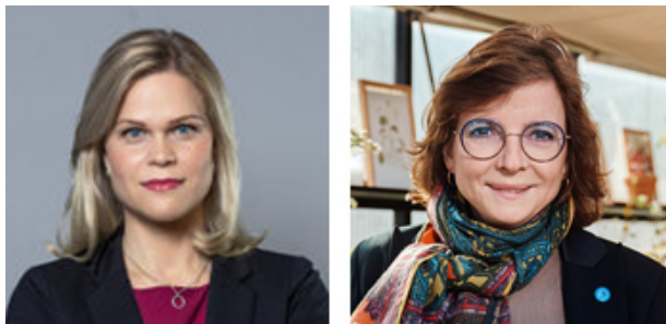
Paulina Brandberg, jafnréttis- og vinnumálaráðherra Svíþjóðar og Karen Ellemann, framkvæmdastjóri Norrænu ráðherranefndarinnar

Í meira en 50 ár hafa ríkisstjórnir Norðurlanda unnið saman að málefnum kynjajafnréttis.