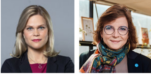
Ruotsin tasa-arvo- ja työmarkkinaministeri Paulina Brandberg ja Pohjoismaiden ministerineuvoston pääsihteeri Karen Ellemann

Pohjoismaiden hallitukset ovat yli 50 vuoden ajan tehneet yhteistyötä sukupuolten välisen tasa-arvon edistämiseksi.