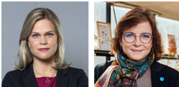
Paulina Brandberg, Ligestillings- og arbejdslivsminister, Sverige og Karen Ellemann, Generalsekretær for Nordisk Ministerråd

I over 50 år har de nordiske regeringer samarbejdet om at fremme ligestilling mellem kønnene.