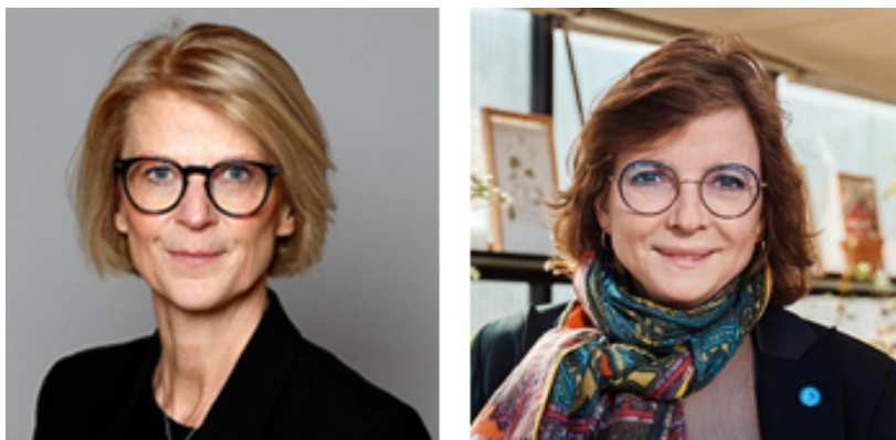
Elisabeth Svantesson, fjármálaráðherra Svíþjóðar og Karen Ellemann, framkvæmdastjóri Norrænu ráðherranefndarinnar

Norrænu forsætisráðherrarnir samþykktu árið 2019 sameiginlega framtíðarsýn um að Norðurlöndin verði sjálfbærasta og samþættasta svæði heims árið 2030. Þetta er mikilvæg og metnaðarfull framtíðarsýn sem krefst skilvirkra aðgerða og stefnumótunar – einnig á sviði efnahags- og fjármála.