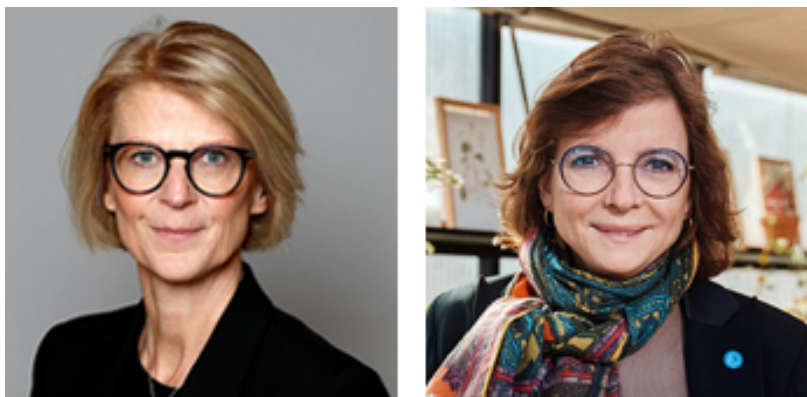
Sveriges finansminister Elisabeth Svantesson og Nordisk Ministerråds generalsekretær Karen Ellemann.

De nordiske statsministre vedtog i 2019 en fælles vision om, at Norden skal være verdens mest bæredygtige og integrerede region i 2030. Det er en vigtig og ambitiøs vision, som kræver effektive indsatser og politikker - også på det økonomiske og finanspolitiske område.