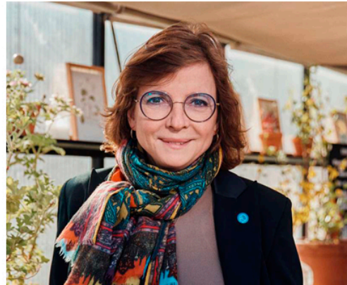
Jessica Rosencrantz, samstarfsráðherra Norðurlanda og Karen Ellemann, framkvæmdastjóri Norrænu ráðherranefndarinnar

Hugsjónin um að Norðurlönd verði sjálfbærasta og samþættasta svæði heims árið 2030 er leiðarhnoða í allri starfsemi Norrænu ráðherranefndarinnar.