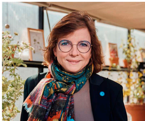
Jessica Rosencrantz, Minister för Nordiskt Samarbete och Karen Ellemann, Generalsekreterare för Nordiska Ministerrådet

Visionen om att Norden ska bli världens mest hållbara och integrerade region 2030 är styrande för Nordiska ministerrådets verksamhet. Samarbetsministrarna har det överordnande ansvaret för samordningen av visionsarbetet, och även ett särskilt ansvar för att främja tvärsektorielt samarbete, att lyfta nordiska frågor internt i regeringarna samt att följa ministerrådets samlade resultat.